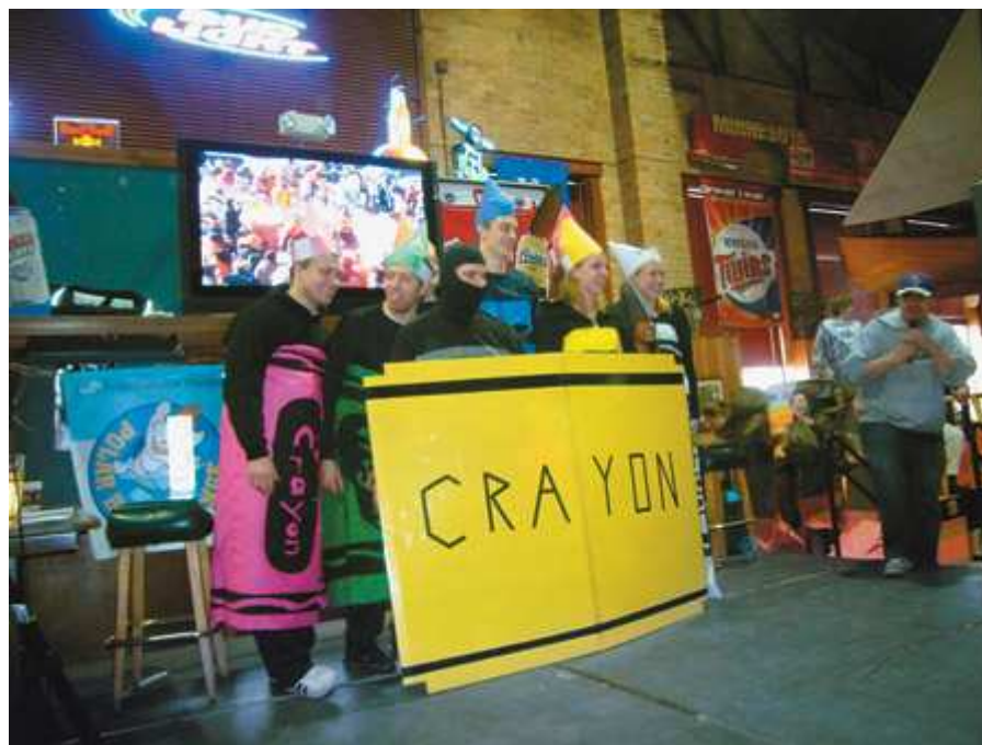
Мелки с человеческим лицом отбеливают репутацию

А в 2000-м провинциальная газета Seattle Post-Intelligencer, регулярно публиковавшая результаты журналистских расследований, заказала двум сертифицированным лабораториям тест. Он должен был проверить версию о наличии асбеста в рисовальных мелках. Согласно официальному релизу, в трех из восьми наиболее распространенных брендах было обнаружено присутствие опасного вещества.